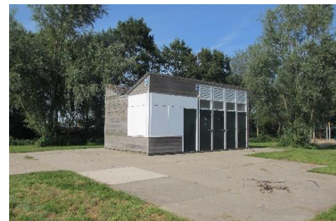
Foto: kiosk met toiletten