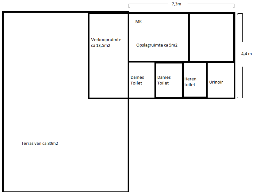
Plattegrond: toiletgebouw met kiosk en terras